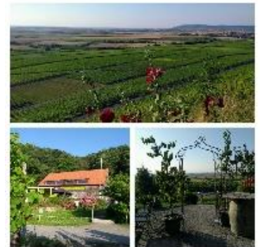
Busbegleitung Im Boxbeutel-Express