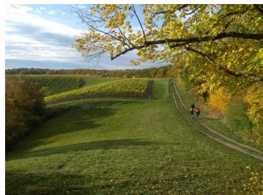
Bunter Spaziergang im Weinberg