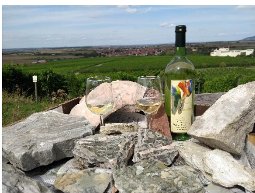
„Wein & Stein“ am Tannenber