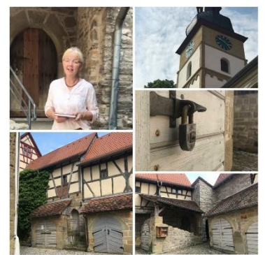
Kirchenburg HÜH Sprichwörtlich