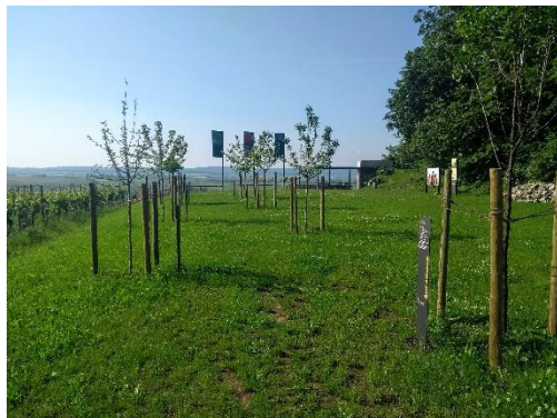
Adelige Spurensuche am Terroirf Punkt in Markt Einersheim