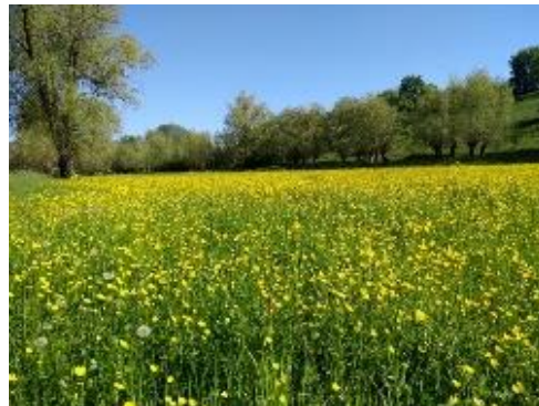
Frühlingserwachen am Wasser